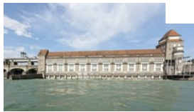
Neben anderen Kraftwerken am Hochrhein gehört auch das Kraftwerk Laufenburg zur Energiedienst Holding.

Der Stromkonzern Energiedienst Holding mit Sitz in Laufenburg hat eine Gewinnwarnung herausgegeben. Grund ist der Verzicht auf den Bau eines Pumpspeicherkraftwerks im Schwarzwald.